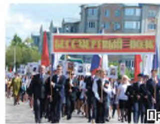
Празднование Дня Победы

На хорошем уровне организовано празднование 235-летнего юбилея города с участием городских и краевых коллективов, Дня Победы, проведение концертов, посвященных государственным праздникам, новогодних и других мероприятий.