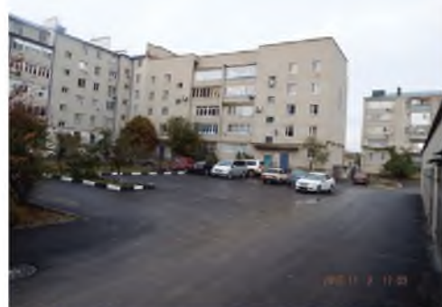
Благоустроенная территория МКД №6 по ул.Новой