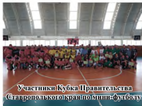
Участники Кубка Правительства Ставропольского края по мини-футболу

Традиционными стали чемпионаты города по футболу, волейболу, баскетболу, мини-футболу, сборная города победила на районных сельских играх.