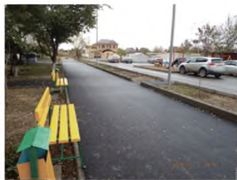
Элементы благоустройства, ул.Новая,8.