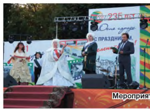
Мероприятия, посвященные 235-летию юбилею города