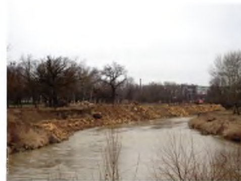
Берегоукрепительные работы в районе нижнего парка

Проведение таких масштабных работ стало возможным благодаря упорным усилиям администрации, которые нашли понимание и поддержку, как со стороны Правительства и министерства природных ресурсов Российской Федерации, так и со стороны Губернатора и Правительства Ставропольского края.