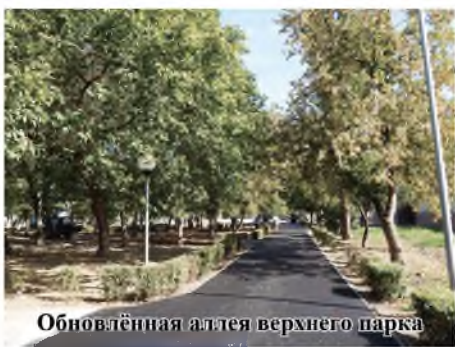
Обновлённая аллея верхнего парка