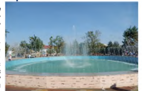
Фонтан в Верхнем парке после реконструкции

Реконструированный фонтан, обновленные прогулочные зоны, пешеходные дорожки, освещение, новые парковые скамейки и урны для поддержания чистоты в парке, обновленные дороги и дорожки в районе пл.Ленина, прилегающие к парку – всё это, безусловно, стало украшением г.Зеленокумска!