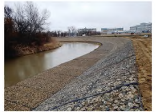
Берегоукрепительные работы в районе Детской поликлиники