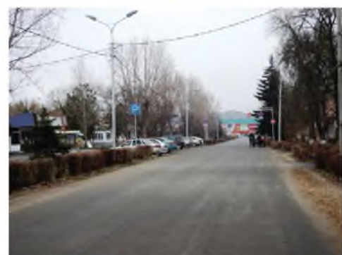
Отремонтированная дорога на пл. Ленина