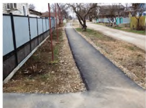
Пешеходная дорожка по ул. Л.Толстого